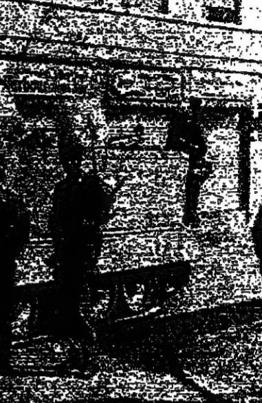
مجموعة من رجال الامن ترصد نشاط القاصية في بيروت